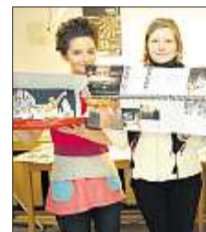
PRODUKTE: Die Doku-Medianer haben viel geschafft in sieben Wochen.

WEIMAR (mh). Sie haben das Programmheft der „Grenztänzer“ so gestaltet, dass die Profis vom DNT „ganz begeistert“ waren. Sie entwarfen „Grenztänzer“-T-Shirts. Und sie haben noch viel mehr gemacht: die Schüler der DokuMedia-Gruppe, die von Medienstudenten der Bauhaus-Uni in die unendlichen Weiten visueller und akustischer Möglichkeiten entführt wurden.