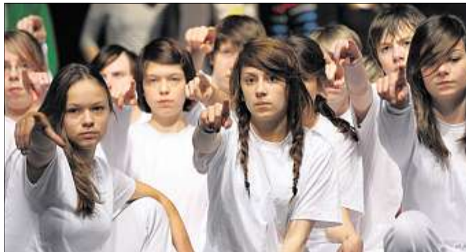
FINGERZEIG: Stumm sprechen die Schüler ihr Publikum am Ende des Abends an.

klumpt es in der Masse, doch streifen sie nun ihre Alltagsklamotten ab, um sich in weißen Shirts und Hosen dem Besonderen zu widmen: der Gemeinschaft und sich selbst. Die Sachen landen in Beuteln, zu Kreisen, dann Haufen arrangiert. Es beginnt das große Sortieren.