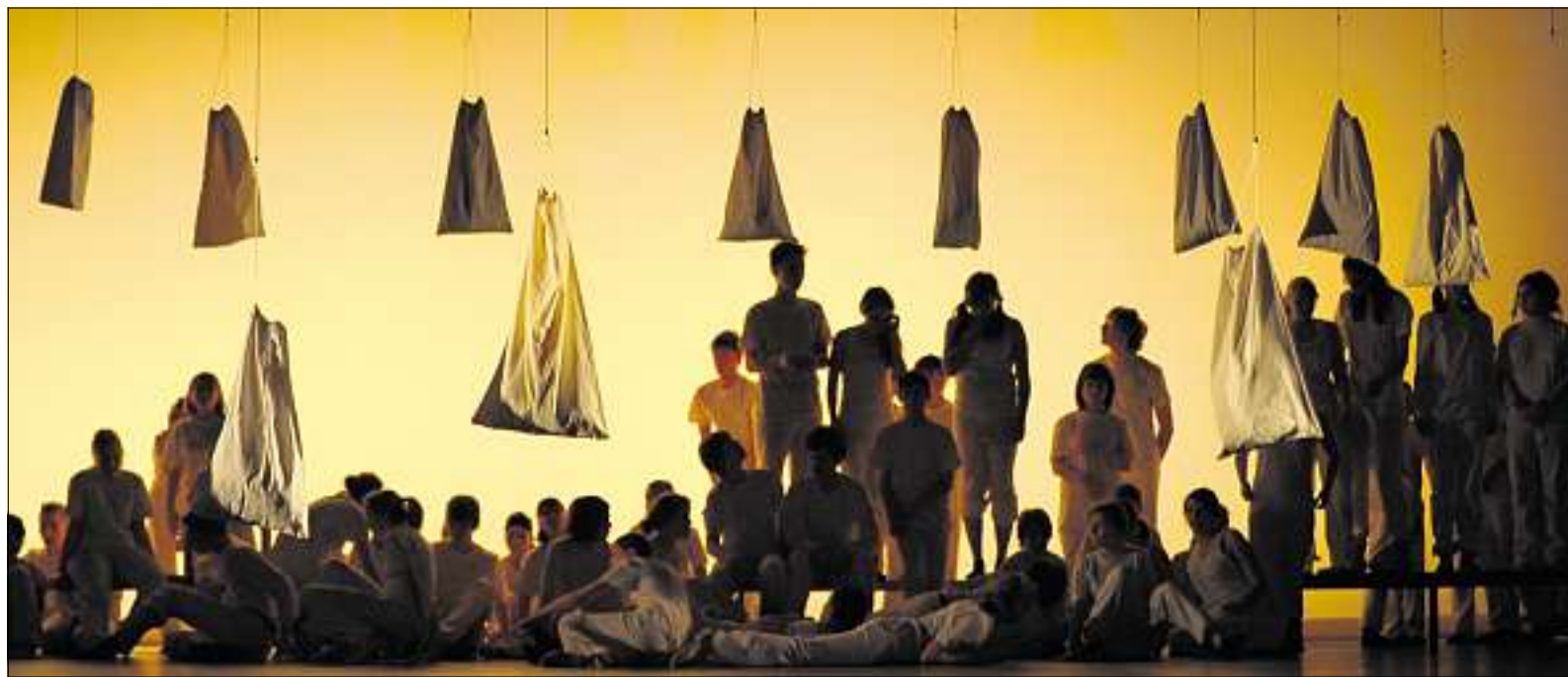
AUFBRUCH: Wie in der Morgendämmerung bewegen sich die „Grenztänzer“ im dritten, letzten Teil der Aufführung – und gehen einen neuen Weg.

TA-Internetservice: http://grenztaenzer.de